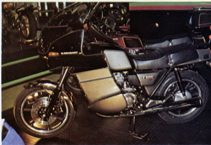
Pour faire la nique aux BMW, la Kawa 1000 ST est aujourd'hui disponible en deux versions carénées : façon USA avec un habillage Vetter ou façon Europe avec un costume qui sort droit de chez un concessionnaire parisien : (27 500 F avec le réservoir de 23 litres).