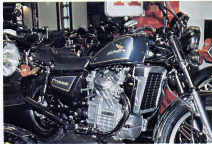
La Honda CX 500 est disponible aujourd'hui en deux versions : 400 Route et Custom. C'est bien entendu le même moteur qui les équipe toutes les deux.