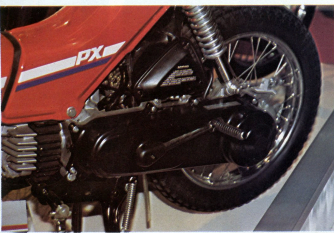
Le 50 Honda PX existe en deux versions, avec ou sans démarreur électrique. Un vrai kick indépendant des pédales, obligatoires sur les cyclos, permet de le démarrer façon moto.