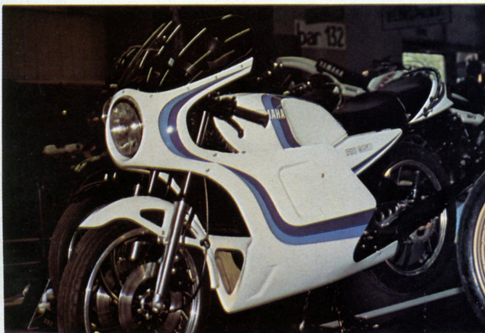
La Yamaha RD 350 LC peut être équipée soit d'un carénage intégral, soit d'une tête de fourche et d'un spoiler inférieur. Environ 1 500 F pour l'intégral.