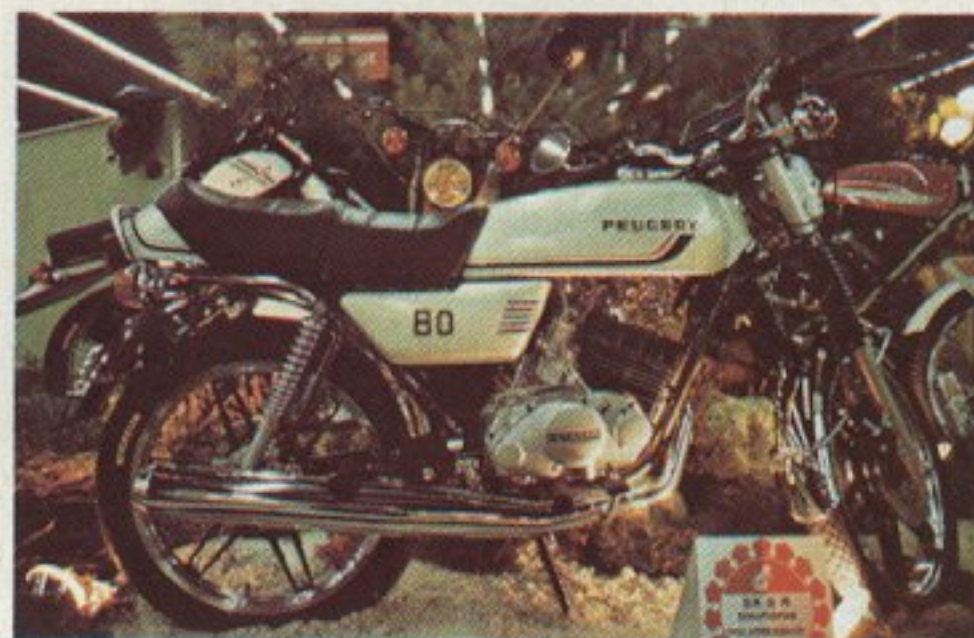
Il y a fort peu de 80 cm 3 au Salon, mais le Peugeot SX8R est là. On est prêt depuis très longtemps à faire face à la nouvelle réglementation chez Peugeot, et on entend bien le faire savoir. Mais si l'on se fie aux réactions du public, la partie est loin d'être gagnée...