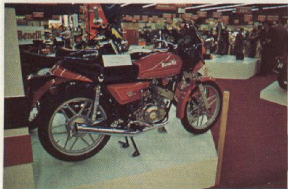
La 125 Sport Benelli est propulsée par un moteur bicylindre deux-temps développant 18 chevaux à 8 100 tr/mn, elle doit atteindre 135 km/h. Elle est jolie, avec le petit carénage de tête de fourche, les pots d'échappement relevés, les roues à bâtons. Le freinage est assuré par un disque à l'avant et un tambour à l'arrière. Le poids : 114 kg.