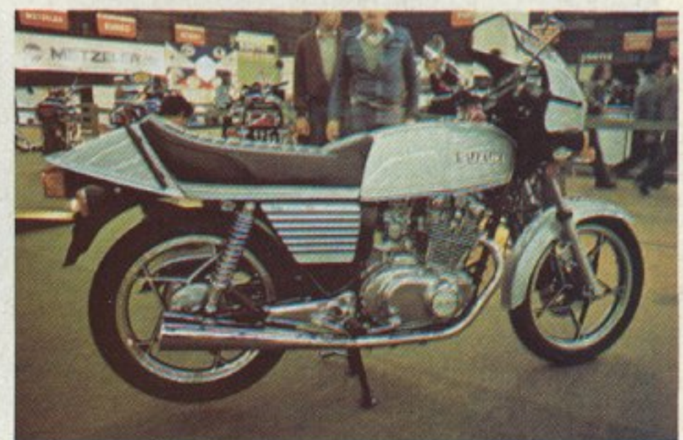
Le stand Suzuki comportait une nouvelle 450, la S, équipée d'un carénage de tête de fourche, de roues à bâtons en étoile, et propulsée par un bicylindre quatre-temps à double arbre à cames en tête. Le freinage est confié à un disque à l'avant et un tambour à l'arrière.